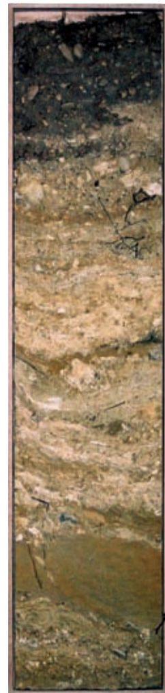
Das Bodenprofil von Bärnreiser zeigt dessen Millionen-jährige Entstehung.